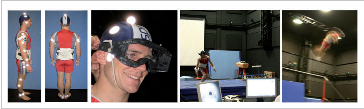
Abb 1. Von links nach rechts: Präparation mit EMG und Infrarotmarkerset (von der Seite, von hinten); Okulographiebrille; Okulographie-Messplatz während schneller Umwendbewegungen; Messung während eines Abgangs vom Reck

Die enge bewegungsassoziierte Verzahnung cervico-okulärer und spinalmotorischer Bewegungsmuster konnte in diesem Projekt durch den erstmaligen Nachweis „bewegungsbezogener Blickfunktionen“ bei komplexen Schraubensaltoelementen bestätigt werden, welche – in Abgrenzung zu den bekannten Prinzipien „umgebungsbezogener“ Blickfunktionen – in bestimmten Bewegungsphasen eine synergistische Kopplung von Auge-, Kopf- und intersegmentalen Körperbewegungen aufweisen. Es wurde außerdem ein Modell präsentiert, welches die intersegmentale, neuro-muskuläre Aktivierungsabfolge innerhalb der vorderen und hinteren Muskelschlinge bei rotationsbeschleunigenden vs. impulsübertragenden Bewegungsphasen beschreibt (Punctum fixum-Punctum mobile Modell; von Laßberg et al., 2009a und 2009b). Hierbei wurde postuliert, dass zu einer möglichst effektiven Rotationsbeschleunigung um eine feste Drehachse die neuromuskuläre Aktivierungsabfolge stets von der Drehachse ausgehend (Punctum fixum) zum drehachsenfernen Körpersegment hin (Punctum mobile) verlaufen muss, bei impulsübertragenden Bewegungsphasen hingegen in umgekehrter Richtung. Da gezeigt werden konnte, dass diese neuromuskulären Aktivierungsmuster häufig nicht mit dem sichtbaren kinematischen Output übereinstimmen, müssen bestimmte Traineranweisungen, welche sich an rein kinematischen Technikleitbildern orientieren (z. B. Videoanalysen) eventuell kritisch hinterfragt werden.