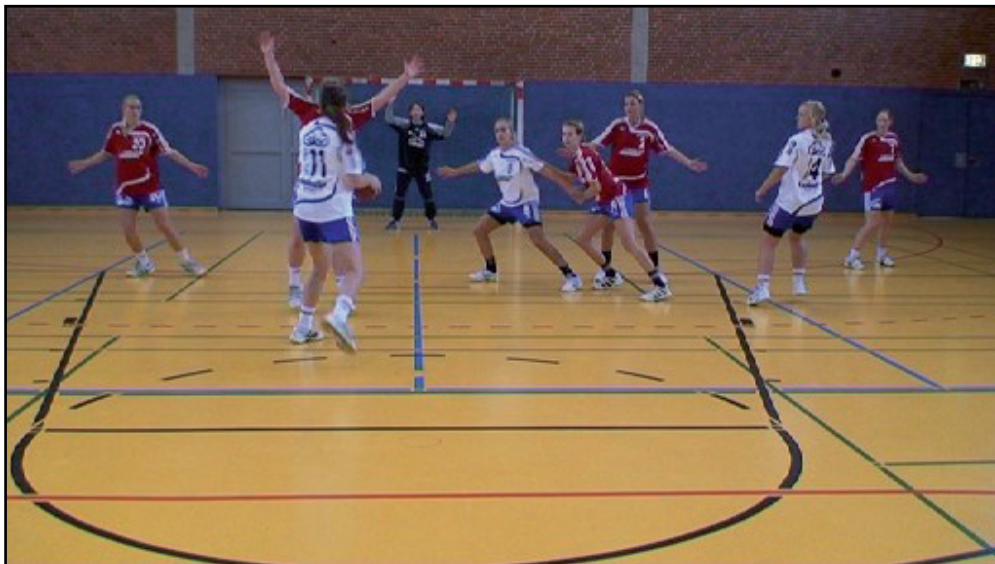
Abb. 1: Standbild einer Videoszene

In Studie 1 und 2 werden den Versuchspersonen in den Testsituationen verschiedene Angriffsszenen per Video vorgespielt. Die Videosequenzen enden in einem Standbild. Zu diesem Zeitpunkt hat der Ballführer mehrere Handlungsmöglichkeiten (siehe Abb. 1). Die Aufgabe der Probanden besteht darin, zuerst intuitiv eine Handlung und dann deliberativ weitere Handlungsoptionen des Ballführers zu nennen und sich am Ende für die ihrer Meinung nach beste Option zu entscheiden.