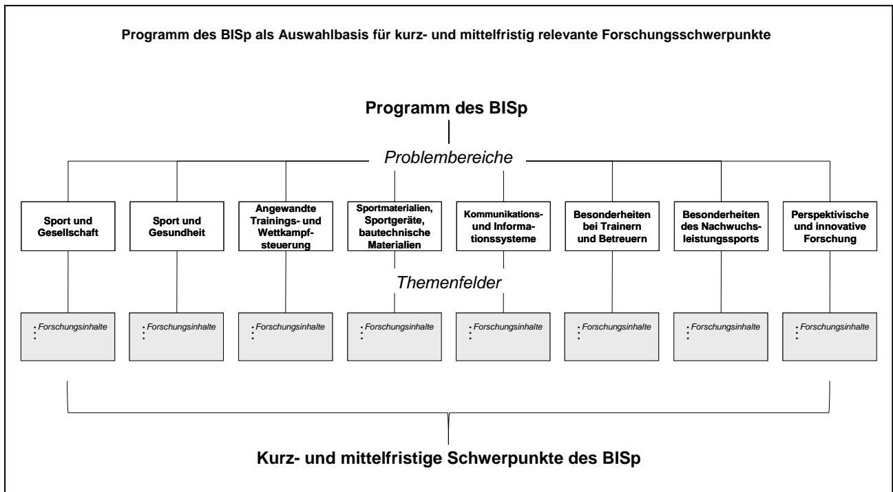
Abb. 2: Struktur des Programms zur Schwerpunktsetzung sportwissenschaftlicher Forschung des BISp mit Nennung der acht Problembereiche

Abbildung 2 gibt einen gegliederten Überblick über die Struktur des Programms des BISp: