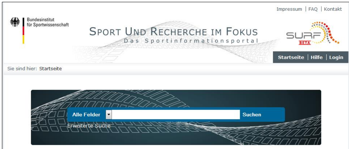
Abb. 1: Einfache Suche im Sportinformationsportal SURF

Unter https://www.bisp-surf.de/discovery/ steht dem Nutzer die gemeinsame Rechercheoberfläche des Sportinformationsportals SURF zur Verfügung. Für die Recherche ist die vor-eingestellte Einfache Suche völlig ausreichend. Hier bietet es sich an, nach dem Titel oder einer Person zu suchen. Die Suche wird durch die ENTER-Taste oder die Suchen-Schaltfläche am Ende des Suchfelds initiiert (siehe Abb. 1 ).