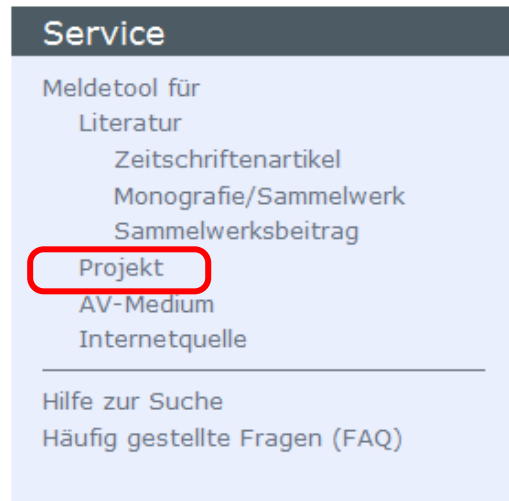
Abb. 6: Navigationspunkt zum Projekt-Meldeformular

Auf der Startseite des Sportinformationsportals SURF befindet sich bereits der Einstiegspunkt zur Meldung neuer Datensätze. Unter der Rubrik 'Service' ist der Link zum format-spezifischen Meldetool zu finden. Mit einem Klick auf 'Projekt' ( https://www.bisp-surf.de/discovery/Report/Form?type=project ) wird anschließend das Formular zur Neumeldung von Projekten geöffnet (siehe Abb. 6 ).