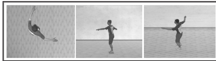
Abb. 1: Screenshots der drei Instruktionsvideos

Videoinstruktion 2 und -feedback werden aus drei unterschiedlichen Perspektiven präsentiert. Zwei Perspektiven stehen orthogonal zu je einer der Hauptbewegungsebenen und eine steht als Kompromissperspektive schräg zu beiden Bewegungsebenen.